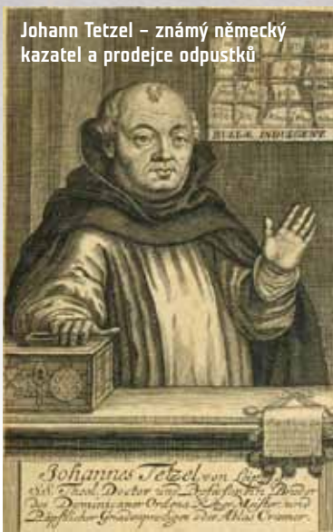
Johann Tetzel - známý německý kazatel a prodejce odpustků

Úředník pověřený prodejem odpustků v Německu, Tetzel, byl usvědčen z nejhorších zločinů proti společnosti i proti Božímu zákonu. Nechal se ale najmout, aby prosazoval zjištěné a bezohledné plány papeže. Docela bezostyšně