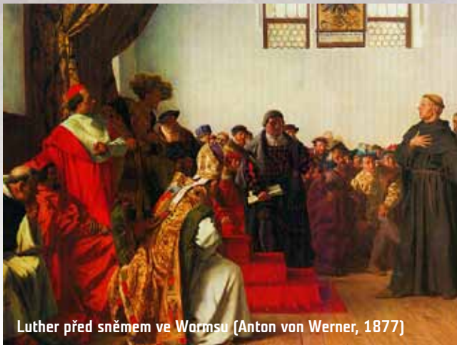
Luther před sněmem ve Wormsu (Anton von Werner, 1877)

Na německý trůn nastoupil nový císař – Karel V. Z Říma se ihned vydali vyslanci, aby papežovi blahopřáli; zároveň ho však chtěli