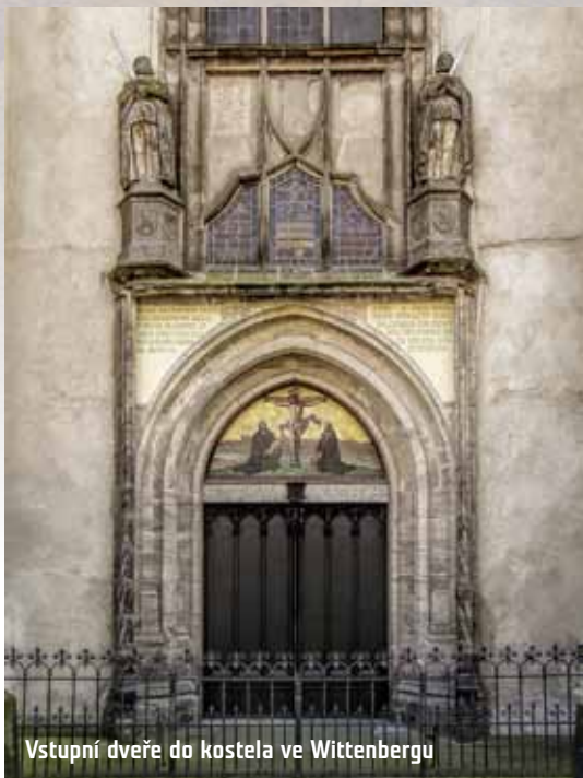
Vstupní dveře do kostela ve Wittenbergu

i pro ryzost své povahy a smysl pro spravedlnost si nicméně získal všeobecný obdiv a úctu. Jeho laskavost, opatrnost a přesnost se dobře doplňovaly s Lutherovou odvahou a činorodostí. Jejich spolupráce byla pro reformaci víta-