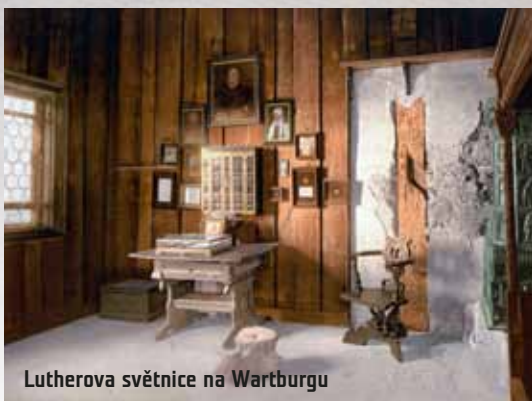
Lutherova světnice na Wartburgu

Ani satan ovšem nezahálel. Pokusil se o to, o co se snažil v každém reformním hnutí – oklamat a ničit lidi tím, že jim podstrčí padělek, který vydává za originál. Působení falešných učitelů zažila církev už v prvním století své existence; a stejně tak se objevovali faleš-